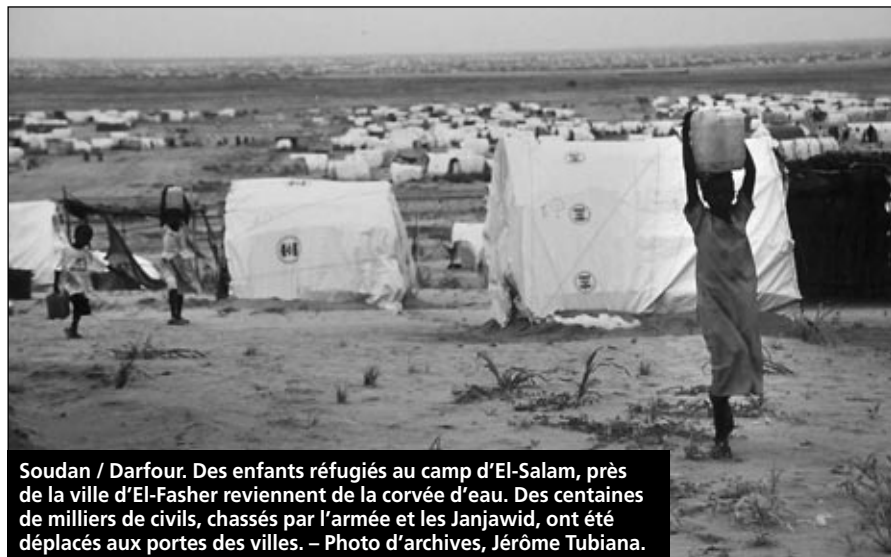
Soudan / Darfour. Des enfants réfugiés au camp d'El-Salam, près de la ville d'El-Fasher reviennent de la corvée d'eau. Des centaines de milliers de civils, chassés par l'armée et les Janjawid, ont été déplacés aux portes des villes.

Les camps de réfugiés sont encerclés en permanence par des forces gouvernementales ou des milices. Cette attaque des forces soudanaises a d'abord été justifiée par la recherche d'armes, puis réfutée par les autorités de Khartoum. Les ONG, quant à elles, ont bien constaté les faits. Ainsi MSF a déclaré avoir pu évacuer les blessés les plus graves (49 personnes, dont une est décédée à l'hôpital) vers l'hôpital de Nyala et s'apprêtait à retourner dans le camp pour soigner les blessés moins grièvement atteints. Cette attaque s'ajoute aux inondations qui ont déjà détruit, selon MSF, plus de 6.000 abris. – AL